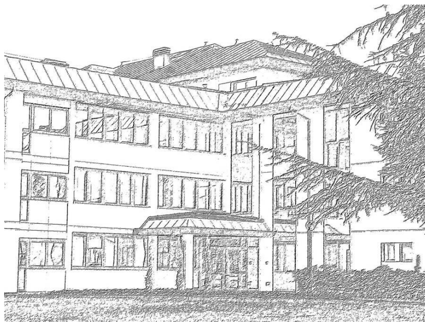
FONDAZIONE "DON ANGELO COLOMBO" - ONLUS TRAVAGLIATO (BS)

FONDAZIONE DON ANGELO COLOMBO O.N.L.U.S.