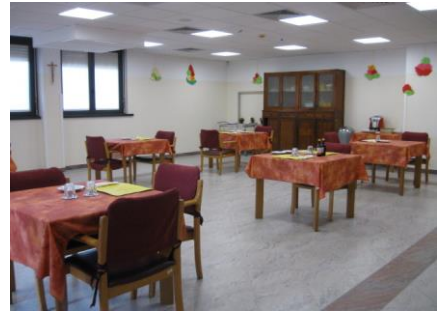
Sala da Pranzo CDI

Il pranzo viene servito verso le 12.00 nella Sala da pranzo del CDI al piano terra.